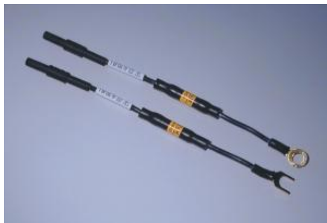
Widok końcówek bateryjnych KB