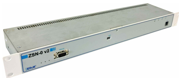
Rys. 1 Widok kontrolera ZSN-0_v2.

Na ścianie przedniej kontrolera umieszczone są gniazda: RS232 do podłączenia siłowni telekomunikacyjnej, gniazdo USB do konfiguracji lokalnej, gniazdo do podłączenia linii komunikacyjnej diody LED sygnalizacyjne. Na tylnej ścianie umieszczone są gniazda do podłączenia zasilania, podłączenia czujników temperatury, gniazda do podłączenia sygnałów dwustanowych oraz analogowych. Kontroler można zamontować w szafie RACK 19' lub 21' z wykorzystaniem odpowiednich uchwytów RACK.