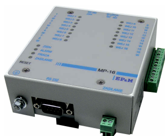
Widok modułu MP-16 w obudowie metalowej.

Moduł umieszczony jest w obudowie przystosowanej do zawieszenia na ścianie lub montażu w urządzeniu na szynie DIN35. Do modułu można podłączyć do 16 sygnałów ze styków bezpotencjałowych lub sygnałów napięciowych o napięciu 24V DC/AC lub 48V DC/AC. Wejścia sygnałów dwustanowych są galwanicznie separowane od potencjałów wewnętrznych modułu i potencjałów napięcia zasilania, a ponadto separowane między sobą co dwa wejścia. Moduł posiada na płycie czołowej diody LED informujące o stanie sygnałów wejściowych.