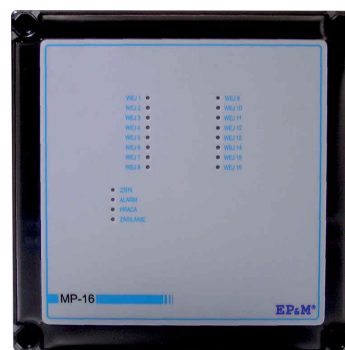
Widok modułu MP-16 w obudowie plastikowej.