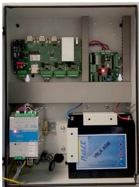
Widok kontrolera UDK